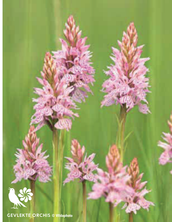
GEVLEKTE ORCHIS