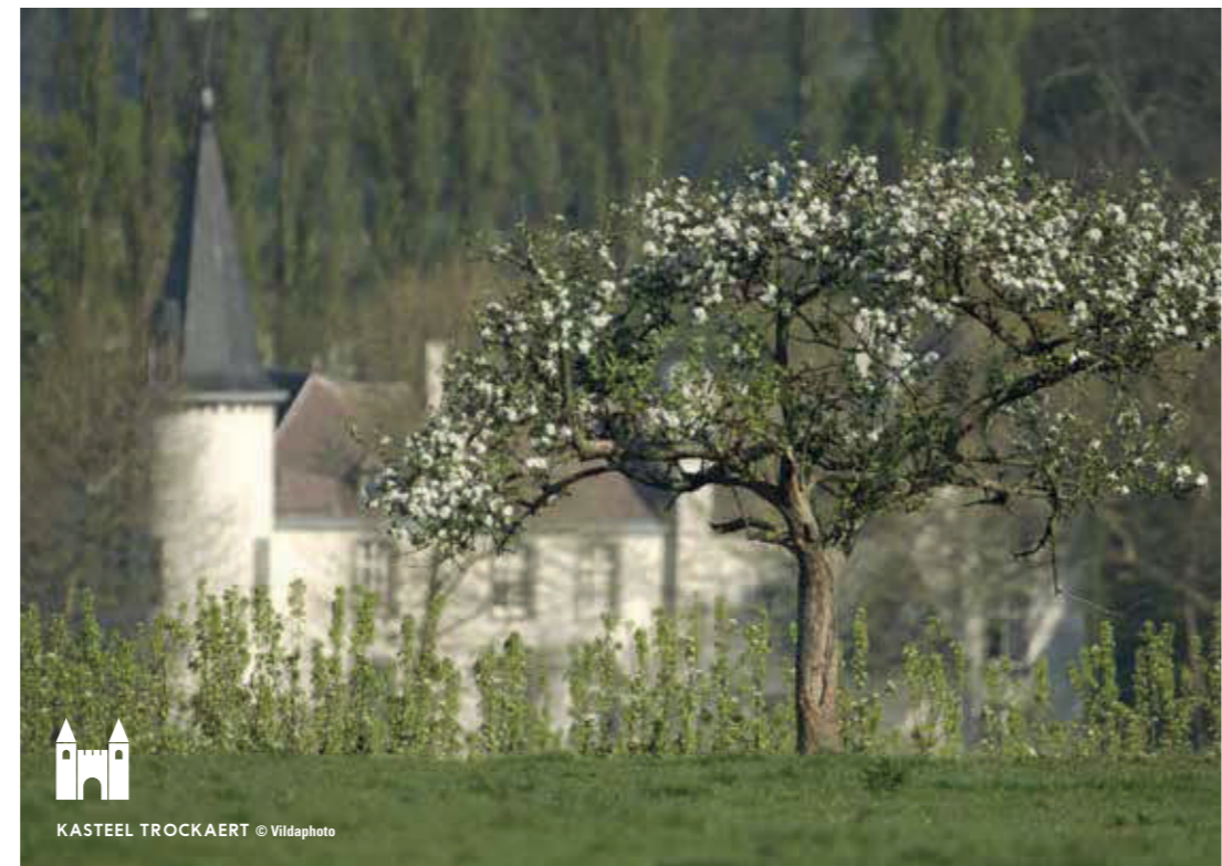
KASTEEL TROCKAERT