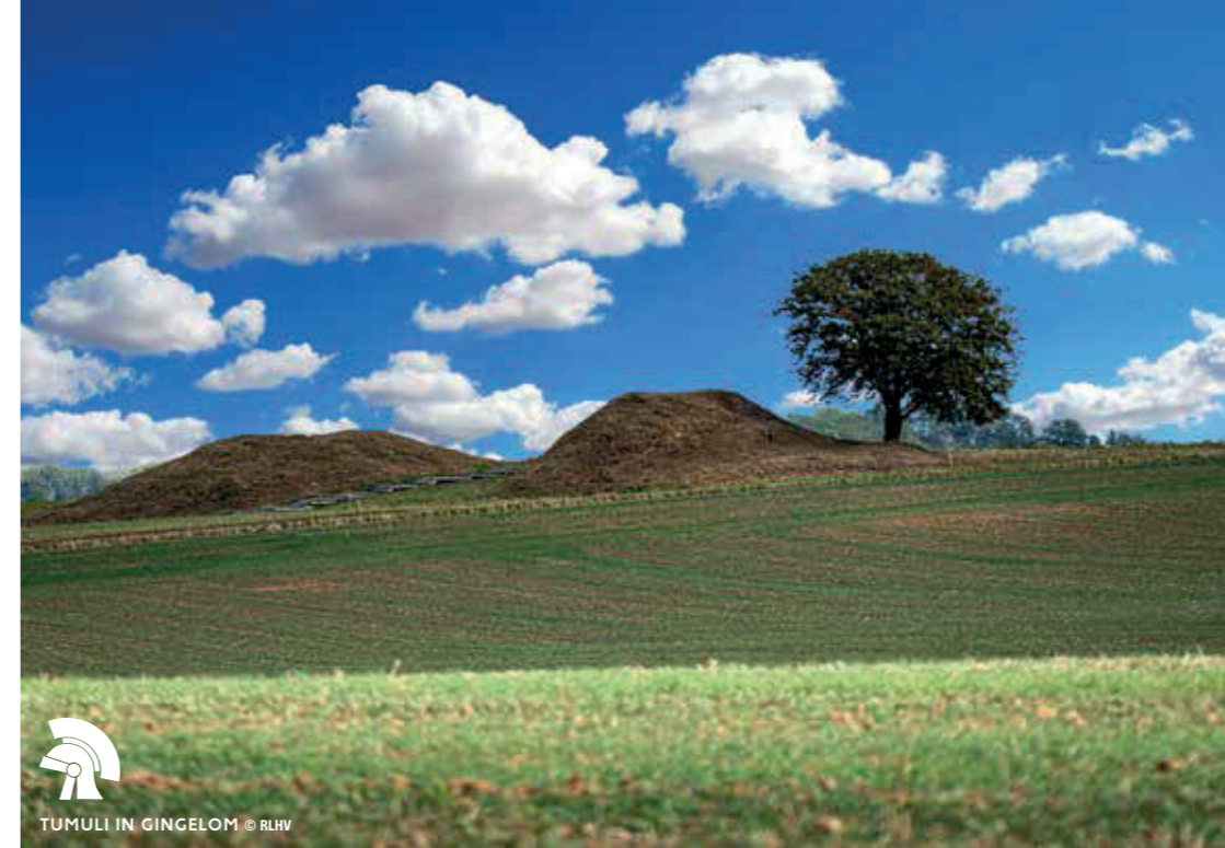
TUMULI IN GINGELOM © RLHV