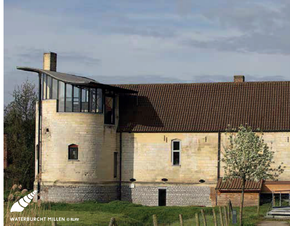
WATERBURCHT MILLEN