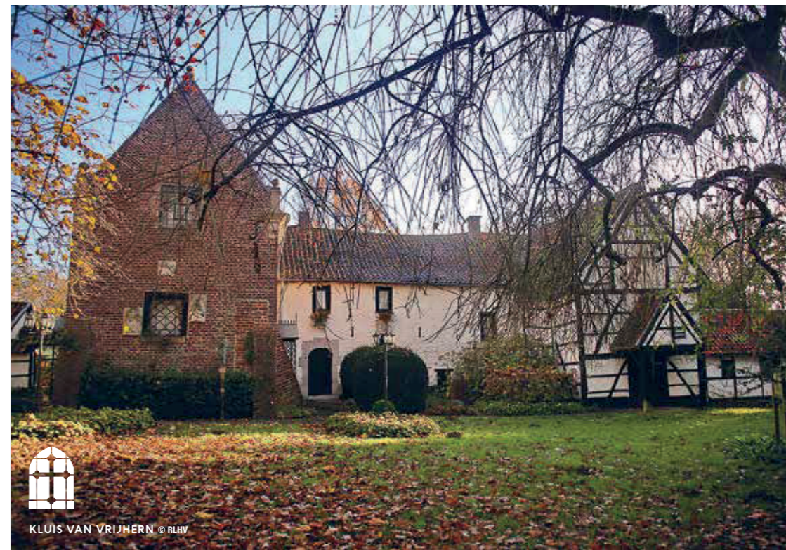
KLUIS VAN VRIJHERN