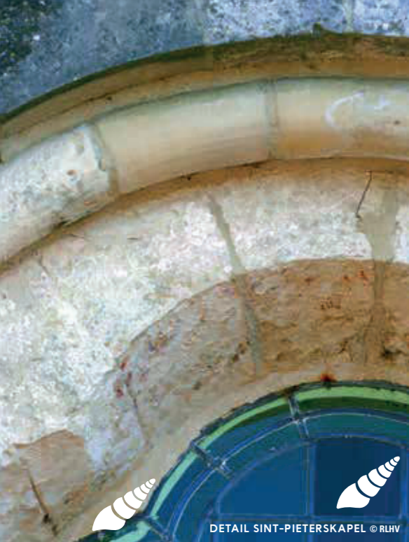
DETAIL SINT-PIETERSKAPEL