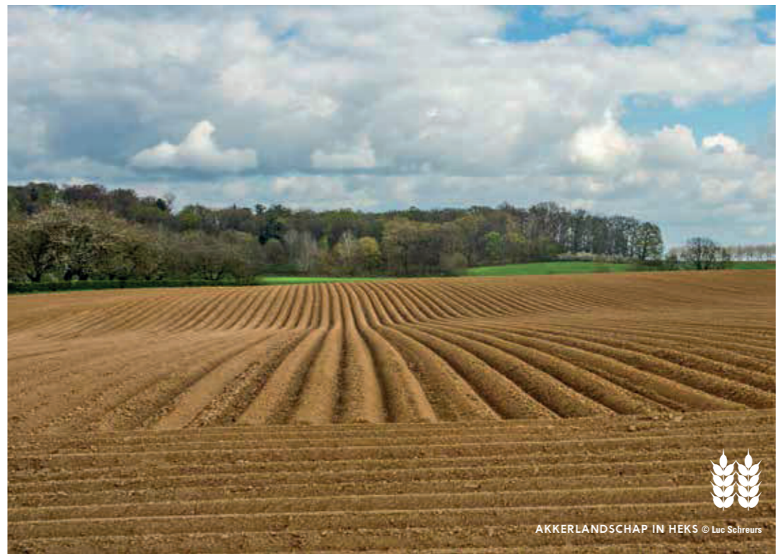
AKKERLANDSCHAP IN HEKS © Luc Schreurs