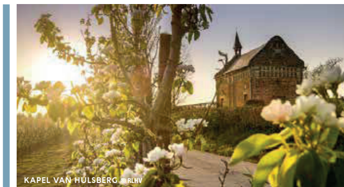
KAPEL VAN HULSBERG

Relicten en verhalen uit verschillende tijdslagen worden verbonden door de Romeinse Weg en het Fruitspoor , die ontwikkeld worden als structurele dragers voor de ontsluiting van betekenisvol toerisme . Zes bovenlokale thematische onthaalplekken worden op strategische plaatsen ingericht, in Alken, Borgloon, Bilzen, Sint-Truiden, Heers en Tongeren. In elk van deze uitvalsbassissen worden de Haspengouwse verhaallijnen ontsloten en worden regionale, nationale en internationale bezoekersstromen in tijd en ruimte begeleid en gespreid.