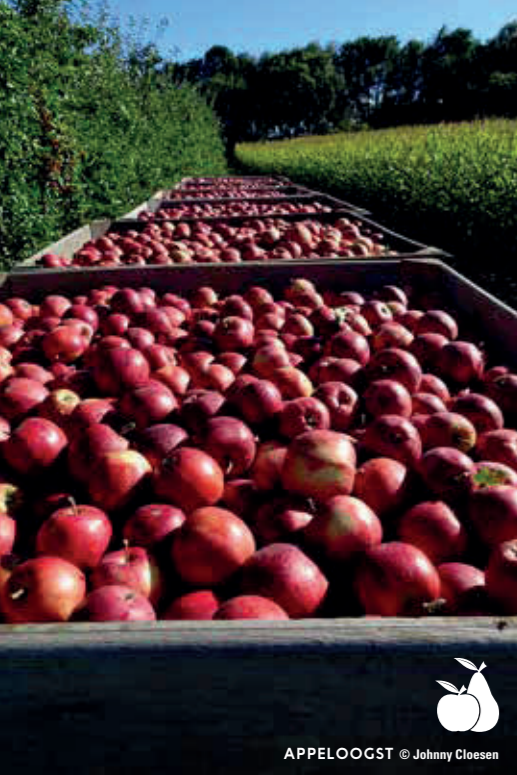
APPELOGST © Johnny Cloesen