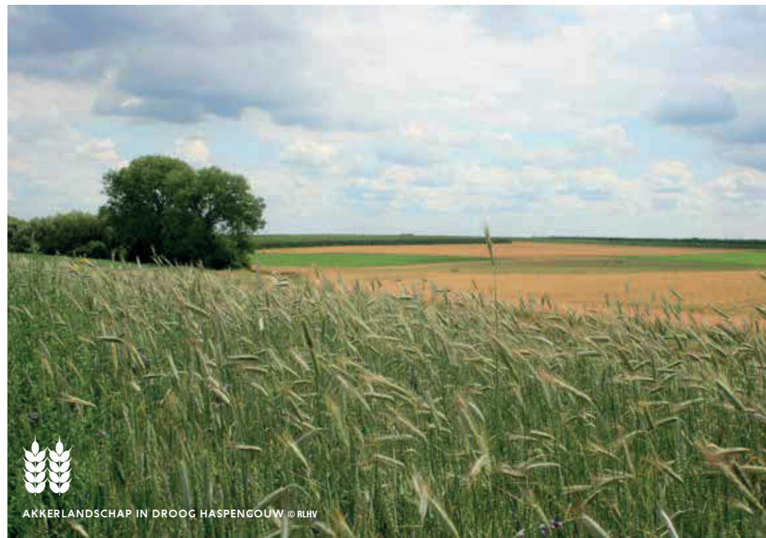
AKKERLANDSCHAP IN DROOG HASPENGOUW