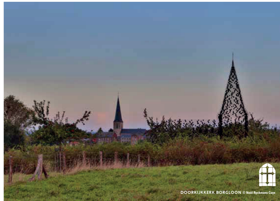
DOORKIJKKERK BORGLOON