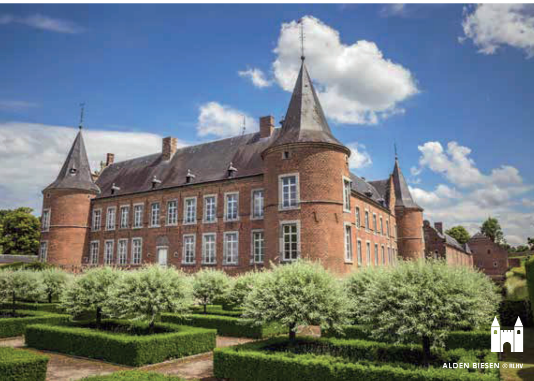
ALDEN BIESEN