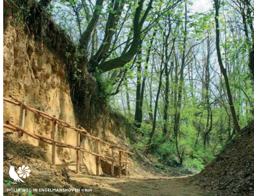
HOLLE WEG IN ENGELMANSHOVEN