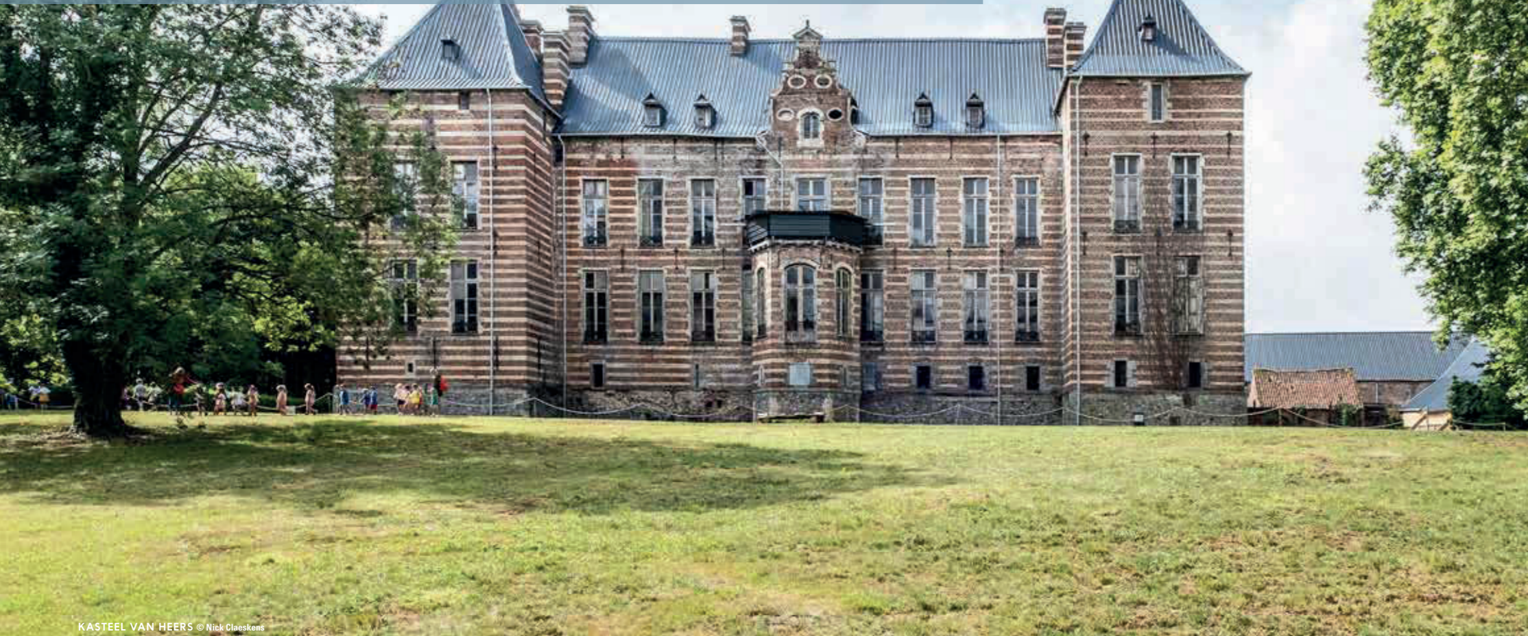
KASTEEL VAN HEERS