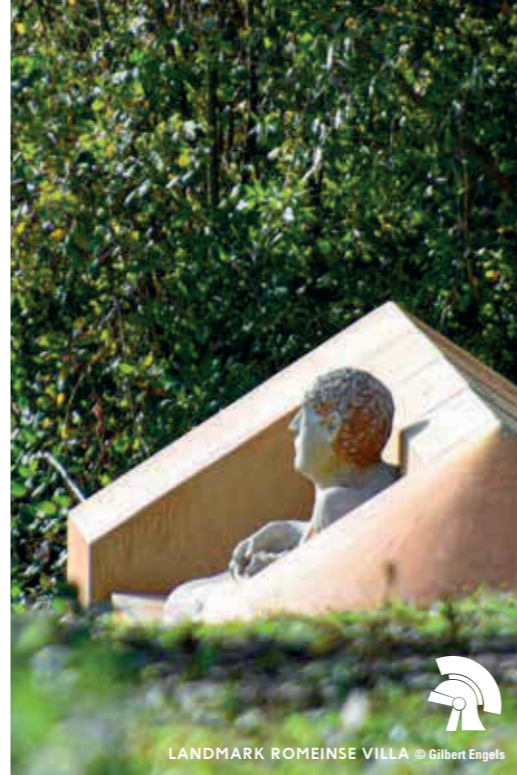
LANDMARK ROMEINSE VILLA