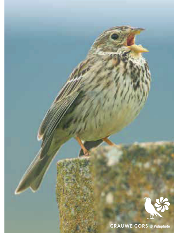
GRAUWE GORS