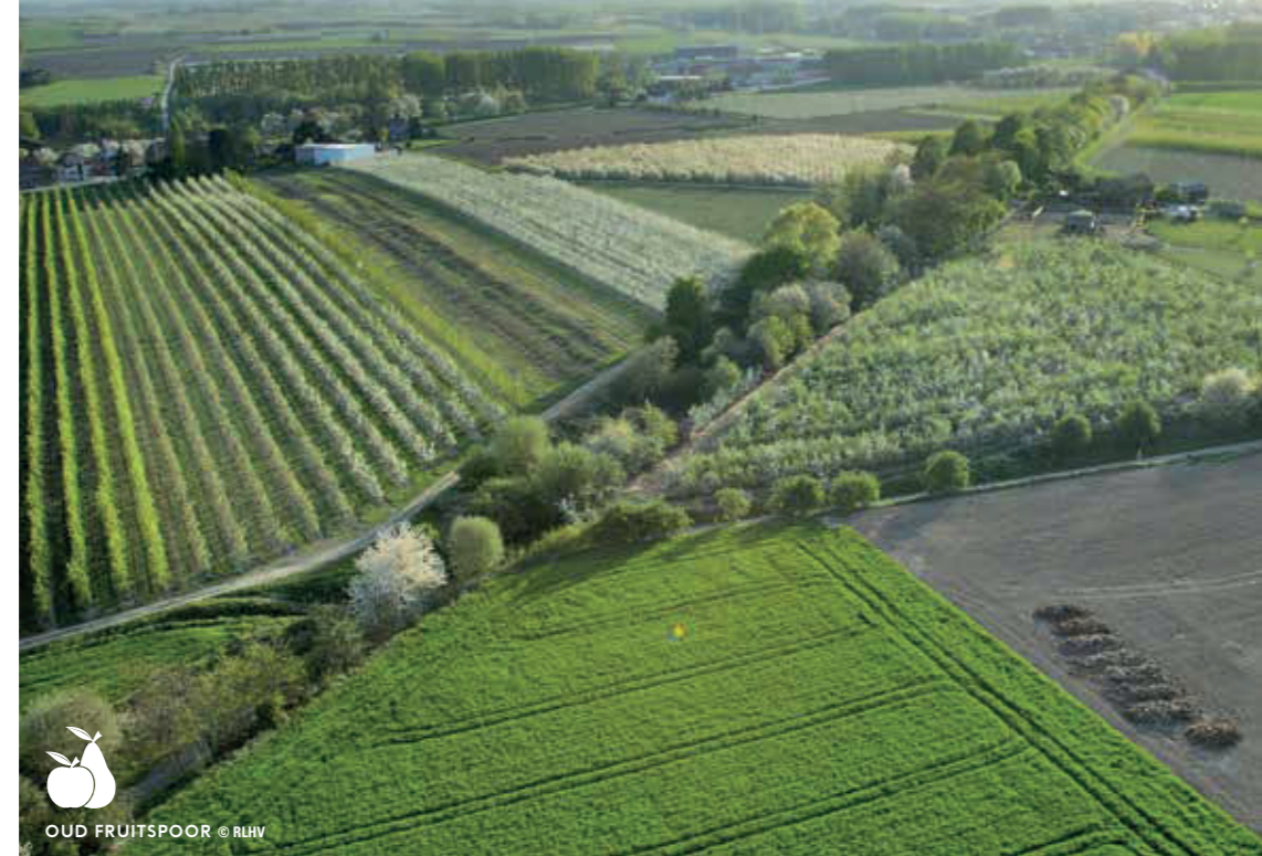
OUD FRUITSPOR