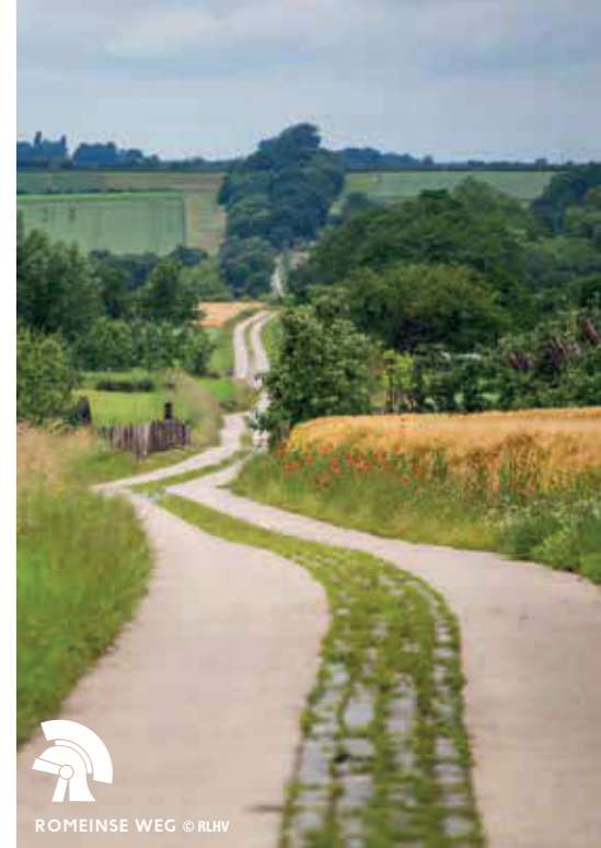
ROMEINSE WEG